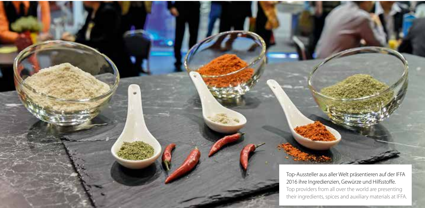
Top-Aussteller aus aller Welt präsentieren auf der IFFA 2016 ihre Ingredienzien, Gewürze und Hilfsstoffe. Top providers from all over the world are presenting their ingredients, spices and auxiliary materials at IFFA.